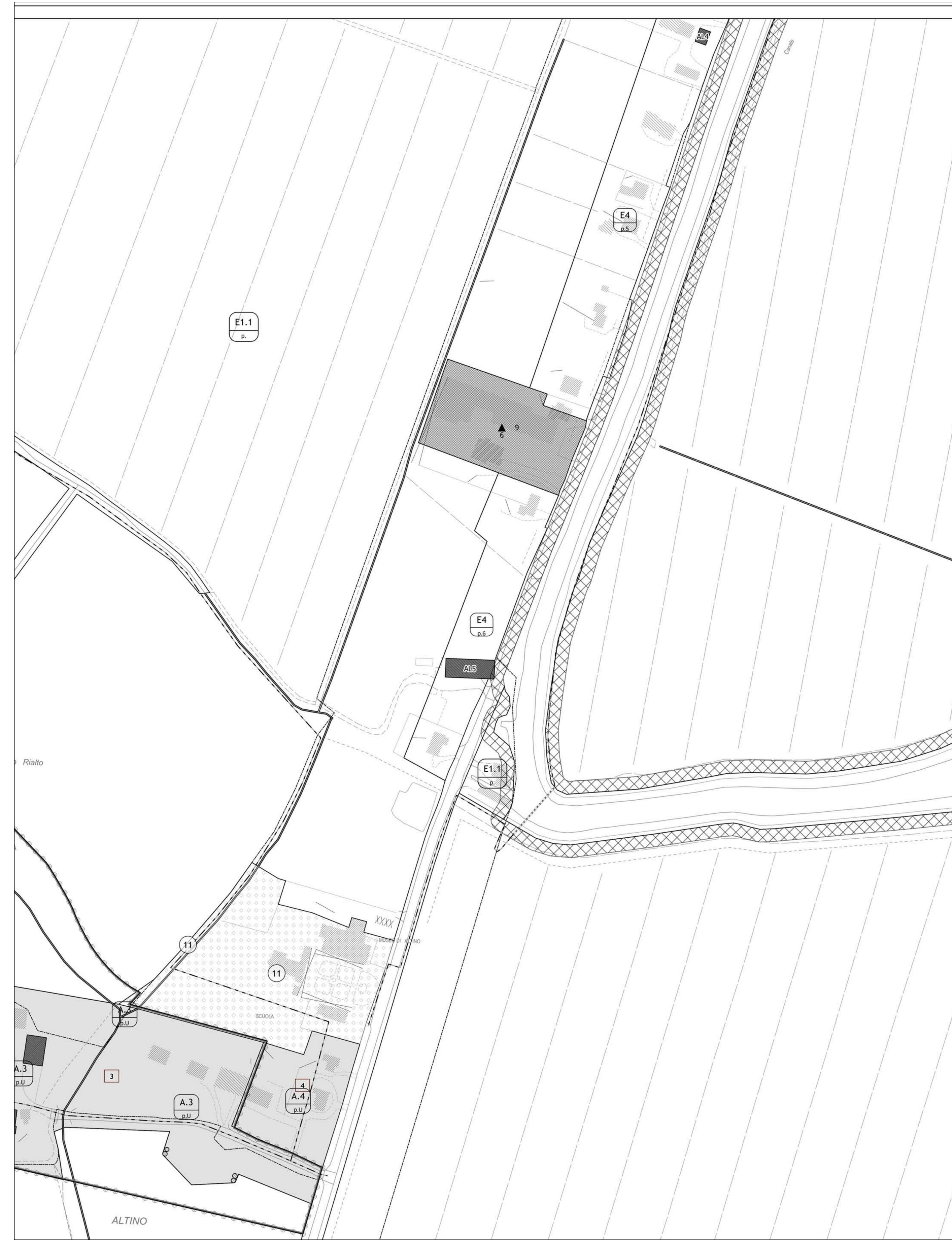
Estratto PI TAV. 4d stato di progetto Scala 1:5.000