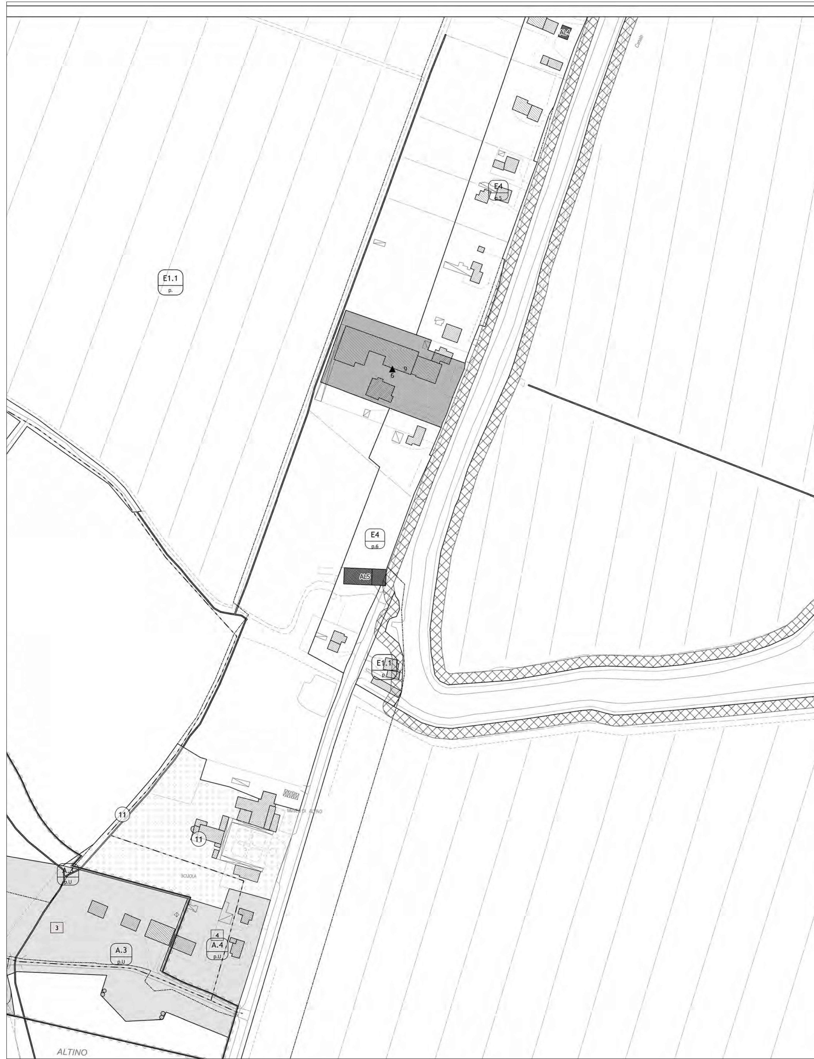
Estratto PI TAV. 4d stato di fatto Scala 1:5.000