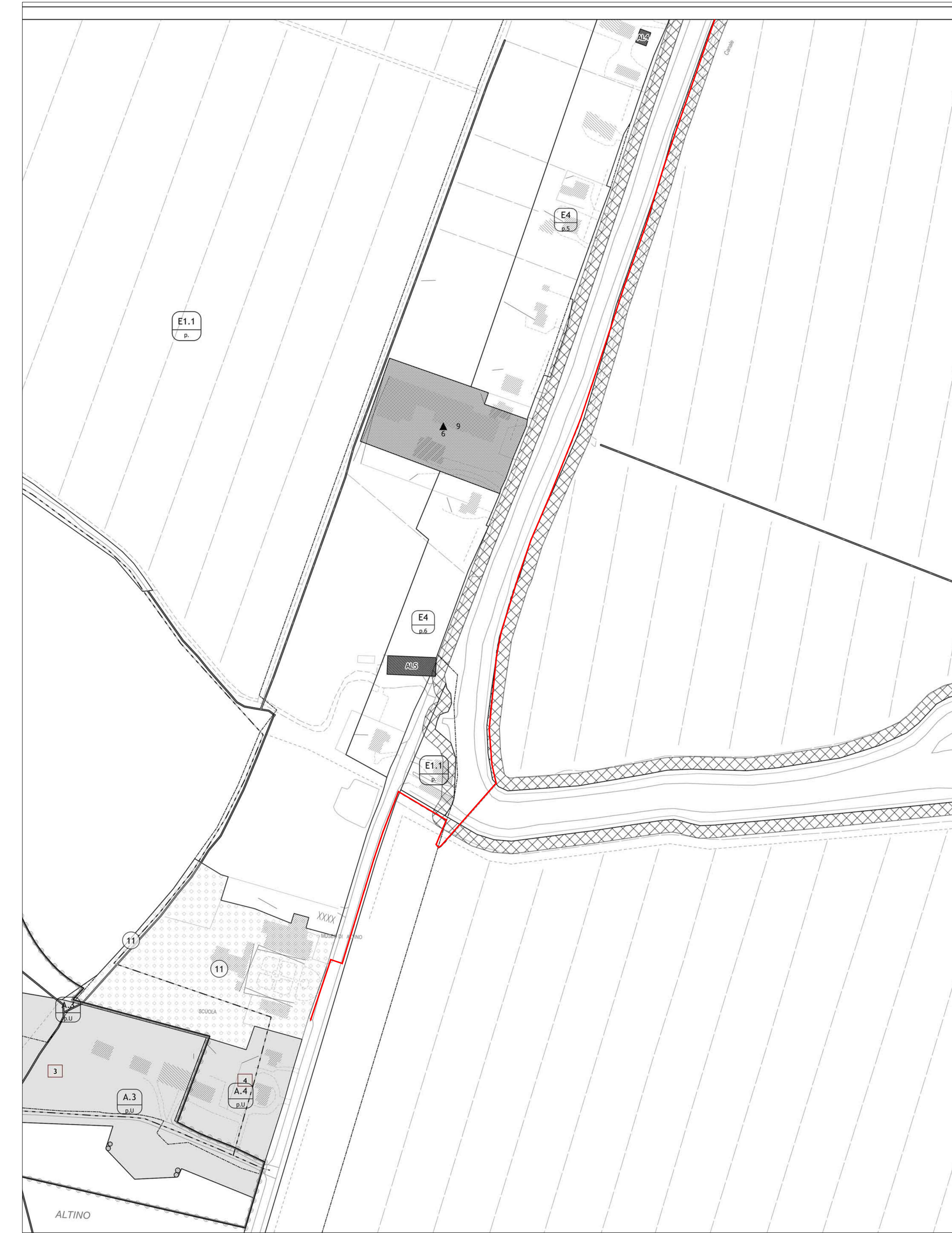
Estratto PI TAV. 4d comparativa Scala 1:5.000